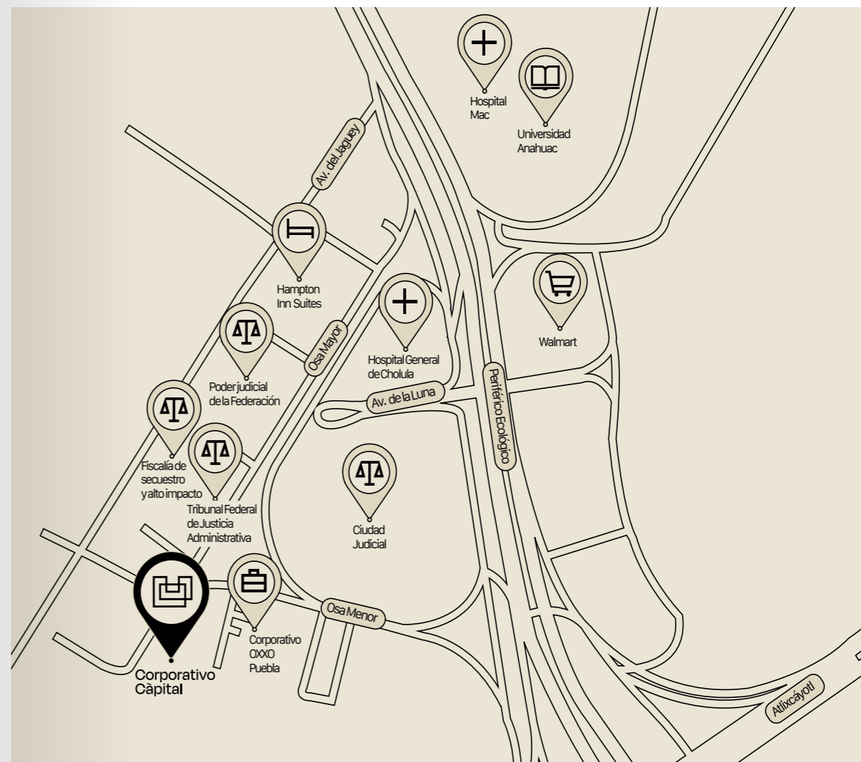
Mapa de ubicación

Ubicado en Ciudad Judicial, una de las zonas de mayor crecimiento de la ciudad, accesible y conectada, Corporativo Càpital inspira un estilo de vida dinámico y móvil. Con juzgados locales y federales, restaurantes, universidades, hospitales, hoteles, plazas comerciales y edificios corporativos al alcance de la mano, este es el lugar en el que deseas expandir las fronteras de tu negocio.