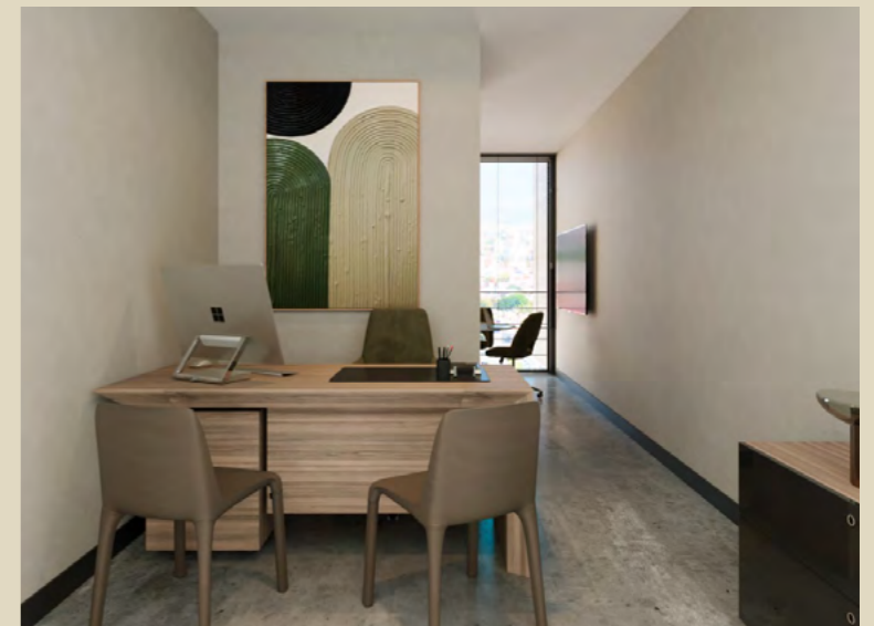
Oficinas 100% terminadas