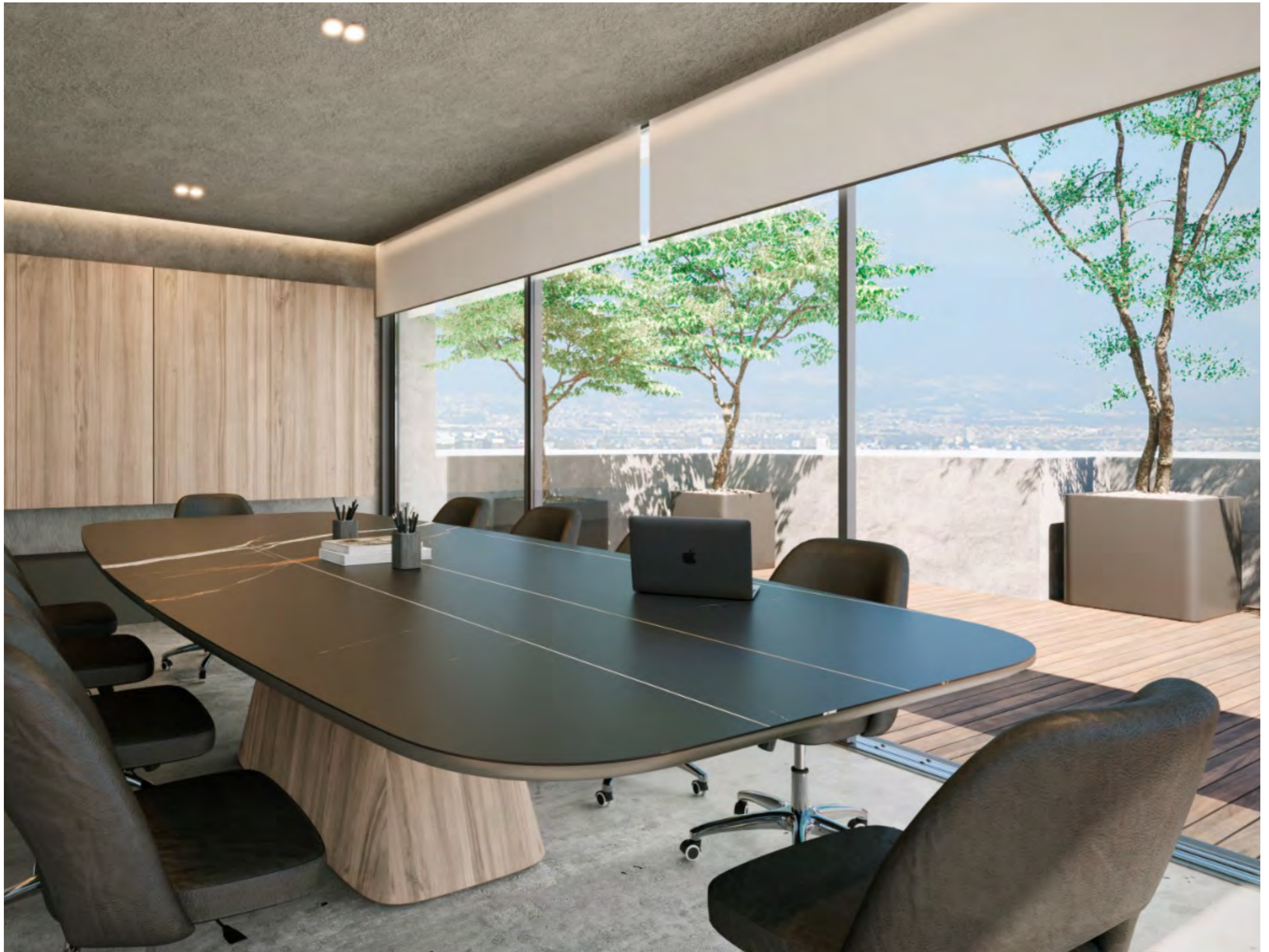
Sala de juntas en roof garden