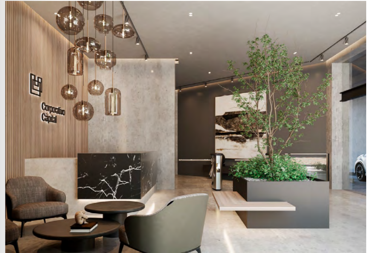
Lobby y recepción