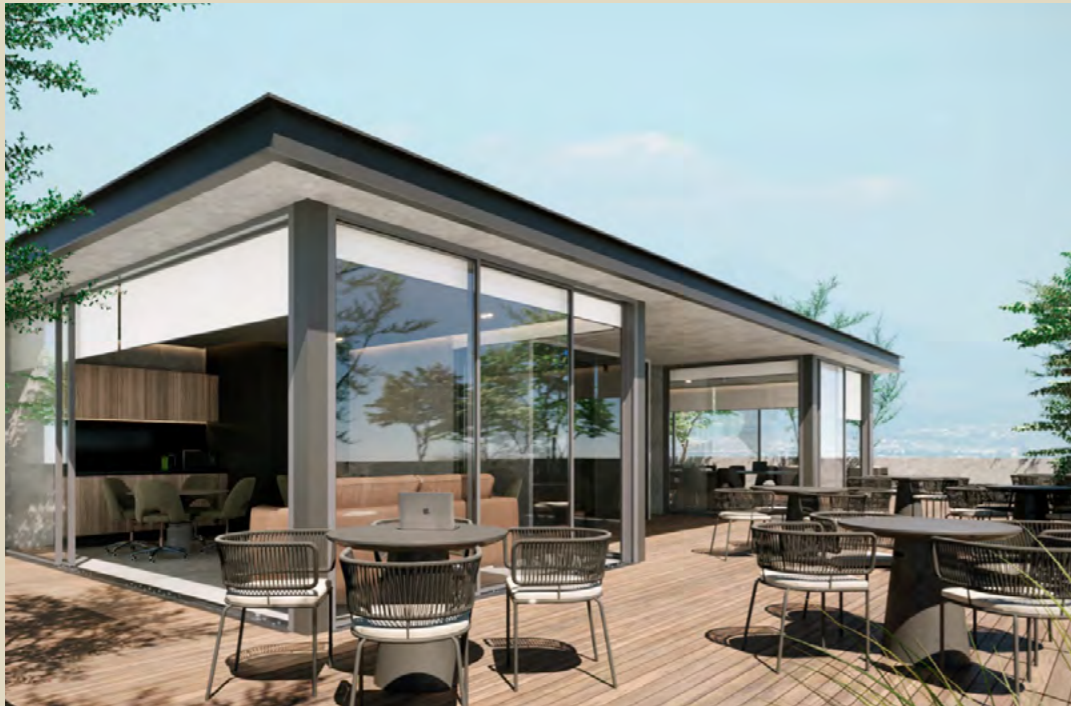
Terraza en roof garden