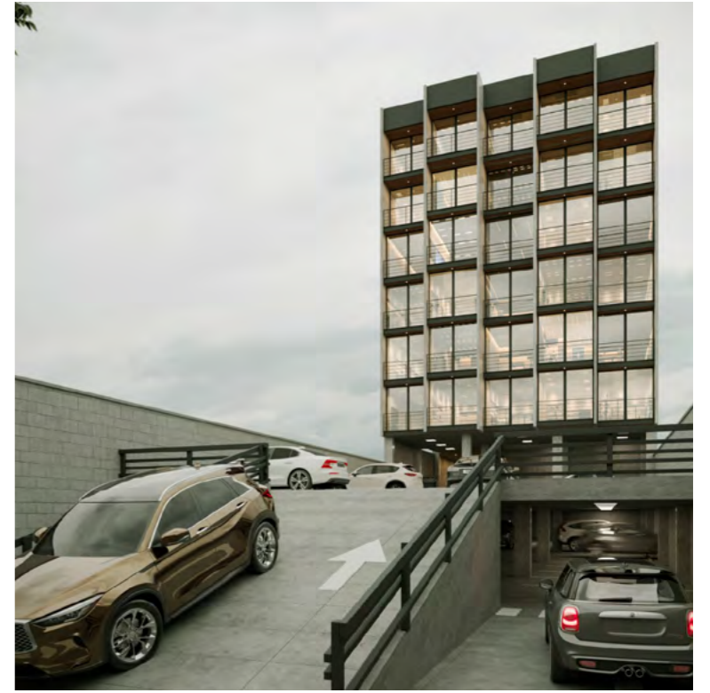
Fachada posterior desde sótano