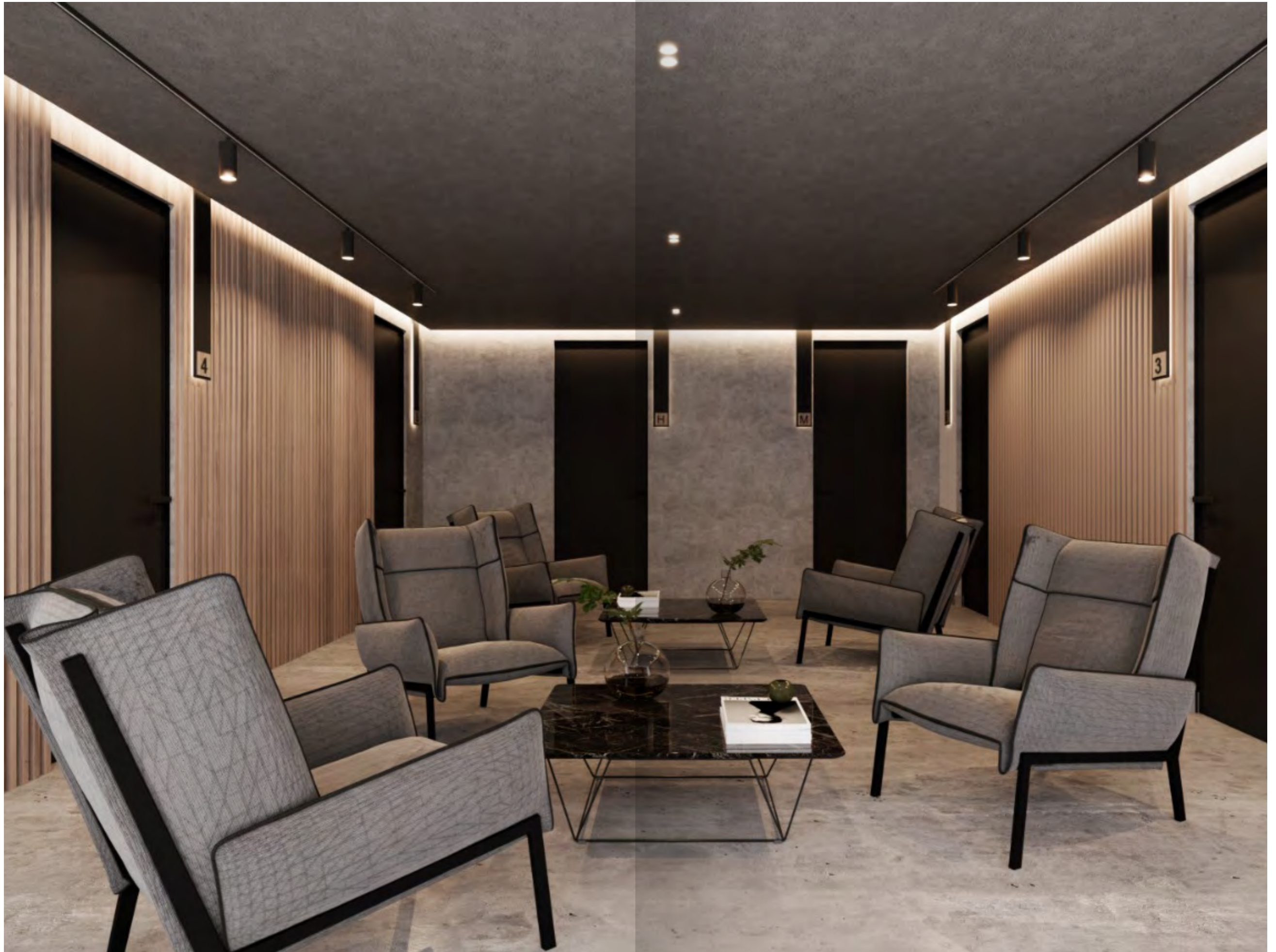
Sala de espera tipo en área de oficinas