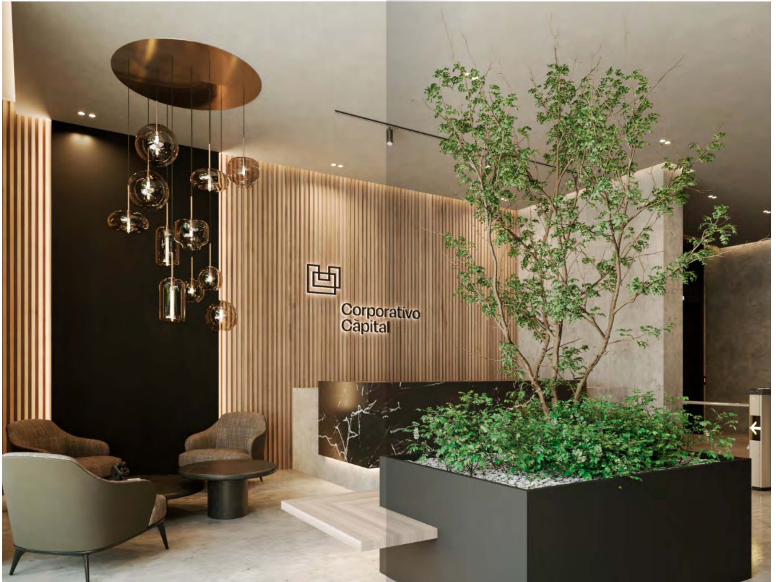
Lobby y recepción